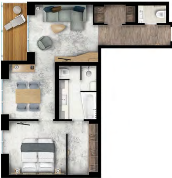
所有图片皆为效果图

● 无极套房: 位于6层甲板, 面积约52平方米(563平方英尺), 配有1张双人床或2张单人床, 以及面积为4.3平方米(46平方英尺)的阳台。其它设施包括冰箱、保险箱、电视、带步入式衣帽间的私人卧室、带沙发床和额外步入式过道衣橱的休息区、2间独立起居室、化妆间、带淋浴、浴缸和地暖的私人卫生间。